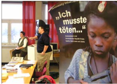
ai- Einsatz zum Thema Kindersoldaten